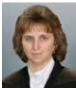
Írta: Csányi Erzsébet lelképásztor